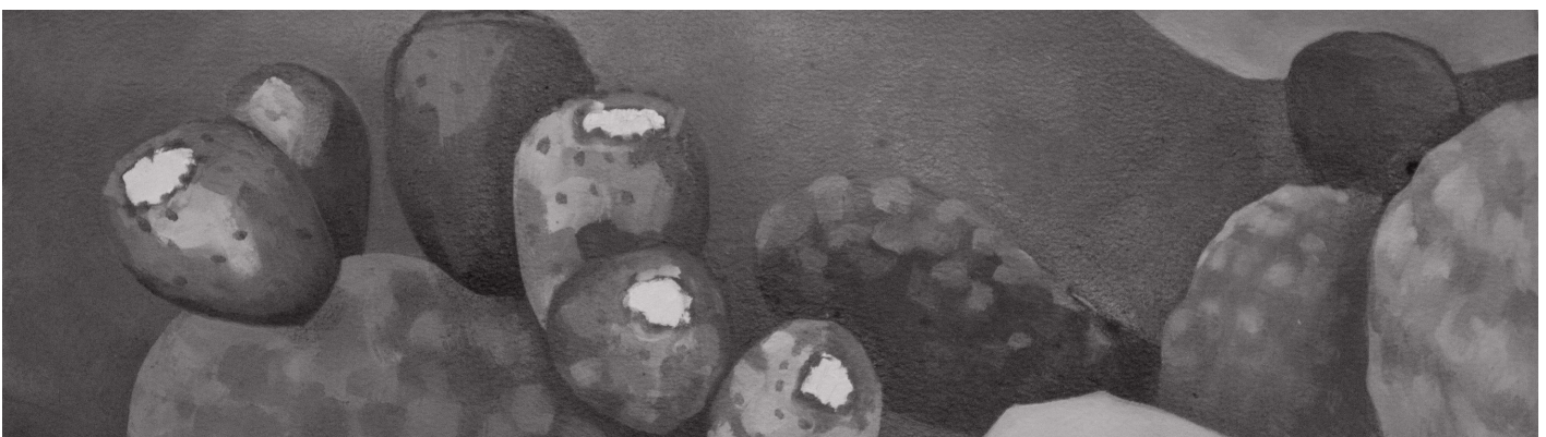
Detalle de "Nopal" de Victoria Hamlin