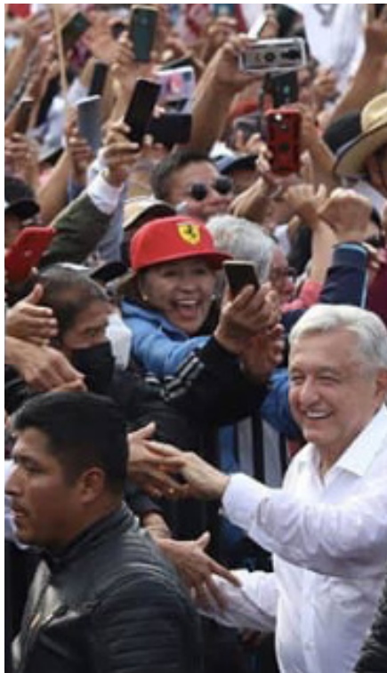
AMLO en la Ciudad de México con sus seguidores. 28/11/2022

fin al imperialismo estadounidense, México es el país más crítico para ese esfuerzo – toma la iniciativa delantera entre los gobiernos latinoamericanos en desafiar la dominación política y económica de Estados Unidos. AMLO boicoteó la Cumbre de las Américas de Biden, citando la decisión unilateral de Estados Unidos de decidir qué países eran aptos para ser incluidos (Cuba y Nicaragua quedaron excluidos). Propuso abiertamente el fin de la Organización de Estados Americanos dominada por Estados Unidos y está presionando por un bloque económico estadounidense que excluya a Estados Unidos.